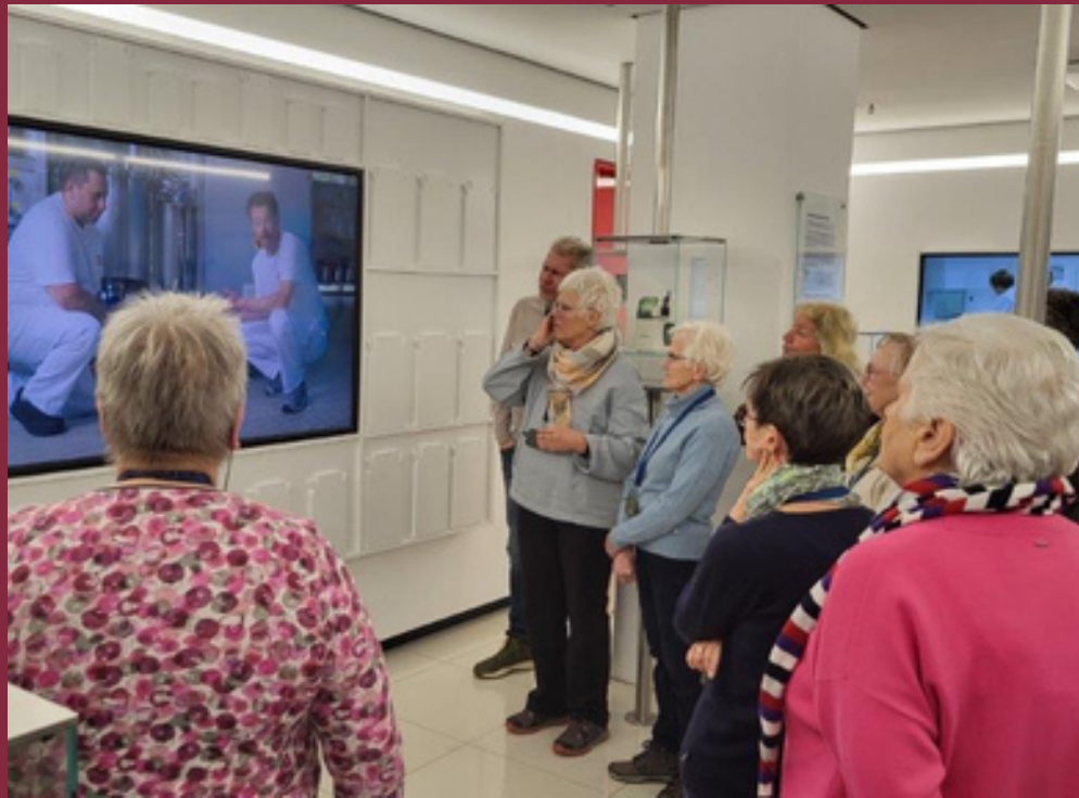
Ausflug zu Dr. Oetker in Bielefeld