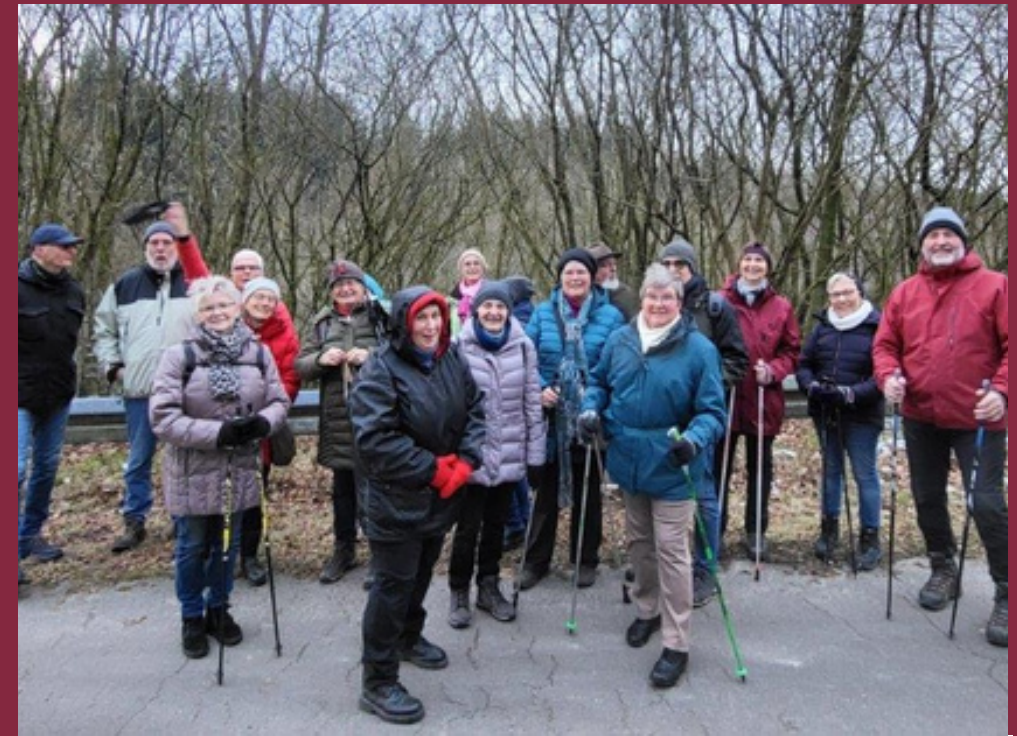
Wanderung Borgloher Schweiz