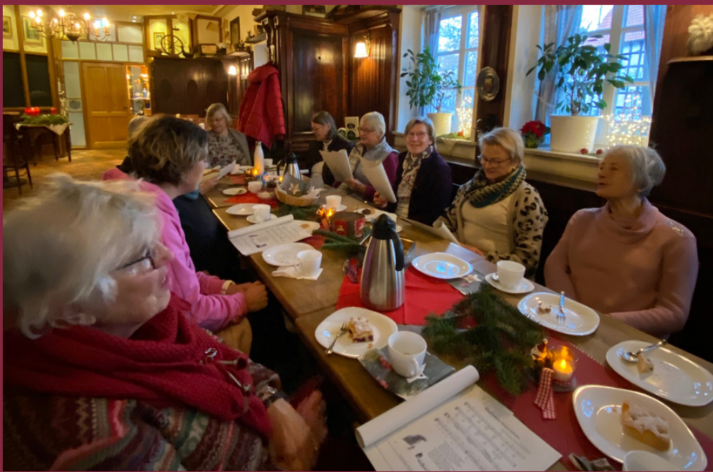
Adventssingen in der LTS